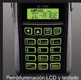
Retroiluminación LCD y teclado