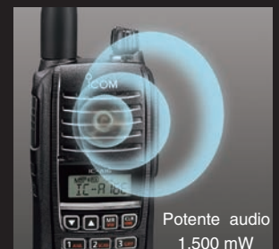
Potente audio 1.500 mW